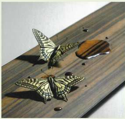
福田亨(1994年生まれ)《吸水》 2022年 黒檀他 *部分