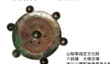
山梨県指定文化財 六鈴鏡 大塚古墳 市川三郷町教育委員会蔵