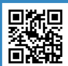
アニメ公式サイト

アニメ公式サイト https://mono-weekend.photo/ アニメ公式X https://x.com/mono_weekend