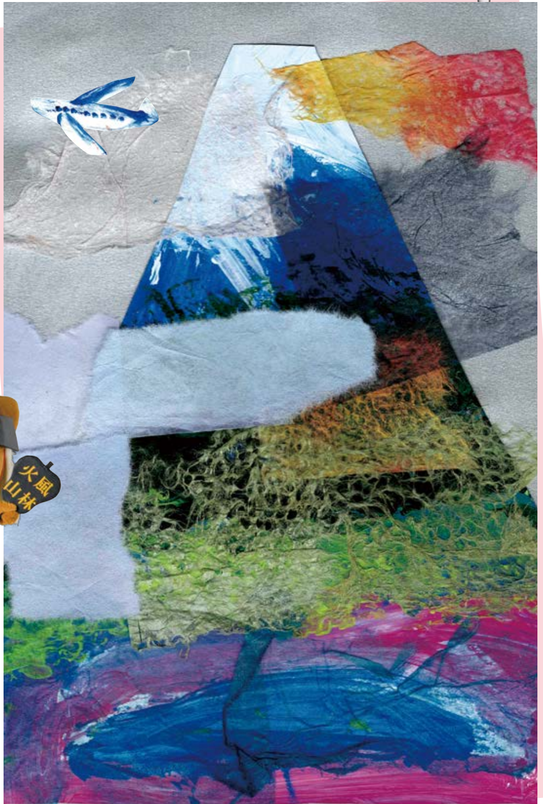
山梨県の社会福祉施設利用者の方が描いた富士山アート(7ページ)