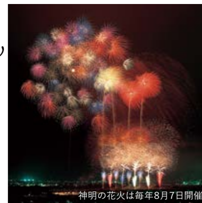
神門の花火は毎年8月7日開催