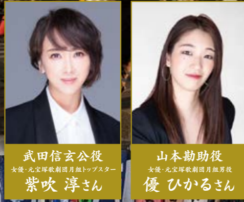
武田信玄公役 女優・元宝塚歌劇団月組トップスター 紫吹 淳さん