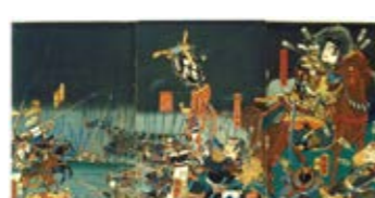
歌川国輝筆「天目山勝頼討死ノ図」(山梨県立博物館蔵)

近年の研究で評価が見直されている武田勝頼。その生涯を振り返り、人物像に迫ります。