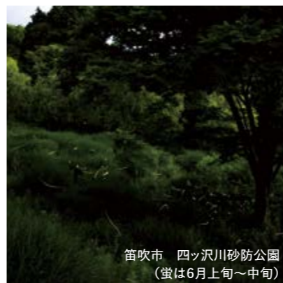
笛吹市 四ツ沢川砂防公園 (螢は6月上旬~中旬)