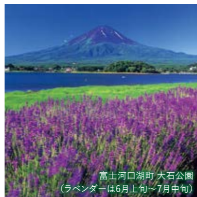
富士河口湖町 大石公園 (ラベンダーは6月上旬~7月中旬)