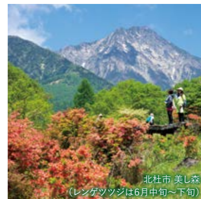
北杜市 美し森 (レンゲツツジは6月中旬~下旬)