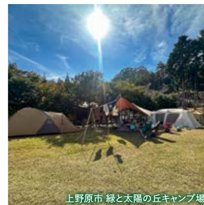
上野原市 緑と太陽の丘キャンプ場