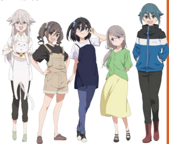
モデル地 北杜市・清里テラス

芳文社『まんがタイムきららキャラット』にて連載中の、あふろによる人気4コマ漫画『mono』。アニメ・実写化も果たした代表作『ゆるキャン△』でキャンプブームを盛り上げたあふろが、写真部と映像研究部が合体した「シネフォト部」に所属する女子高生たちを中心に描く『今週末の楽しみ方漫画』。360°パノラマカメラでの撮影や、肩にカメラを括り付けた疑似ドローンなど様々な技法を用いて、山梨県甲府市を中心とした景色や彼女たちの日常を切り取っていく。 『ひだまりスケッチ』や『ぼっち・ざ・ろっく!』など、様々な作品をアニメーションとして送り出したアニプレックス×芳文社のタッグに、新進気鋭のスタジオソフネが加わり映像化が実現。新たな週末の遊び方を、一緒に見つけませんか?