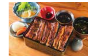
甲州郷土料理 わらじ