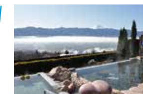
やまなしフルーツ温泉 ぶくぶく