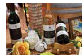
河口湖 赤富士ワインセラー