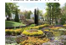
ハーブ庭園 旅日記 勝沼庭園