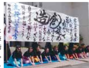
甲府西高校 書道部

甲府西高校書道部は古典の臨書や書道パフォーマンスを軸と して日々活動しています。古典の臨書を通して先人の優れた筆 法を自分の中に取り込んで己の書を作り上げ、培われた技術 を創作作品や書道パフォーマンスの制作に活かしています。 県内で最も早く書道パフォーマンスを行った「伝統校」として、 部員一丸となってみなさんの心に届く作品をお届けします。