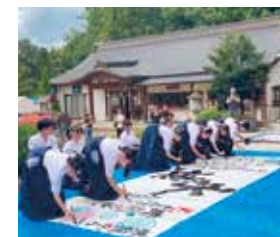
駿台甲府高校 書道部

駿台甲府高校書道部です。この度は山梨 を代表する一大イベントにステージ参加 の機会をいただき大変光栄です。県内外 から信玄公祭りに足を運んでいただいた 皆さまにとって、良き思い出の1ページとな るよう、日頃の練習の成果を発揮して最高 の笑顔と感動をお届けします。部員一同、 精一杯頑張りますので駿台甲府の書道パ フォーマンスをお楽しみください。