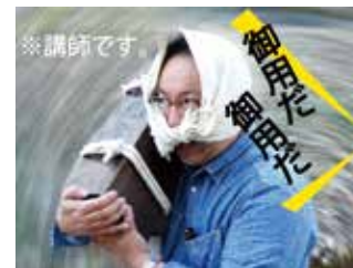
千両箱持ち上げ体験もできるよ!