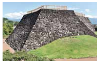
甲府城の石垣って、凄いでせよ!

【石垣の石はどこからきたのか?】【こんな所に城下町のお堀があるの!?】【甲 府城「1400両」盗難事件!】などなど、意外なお話がいっぱい。 甲府城と城下町にまつわるディープなお話ばかりですが、すべて小学生が楽し める内容となっています。当日は千両箱持ち上げ体験も実施します!